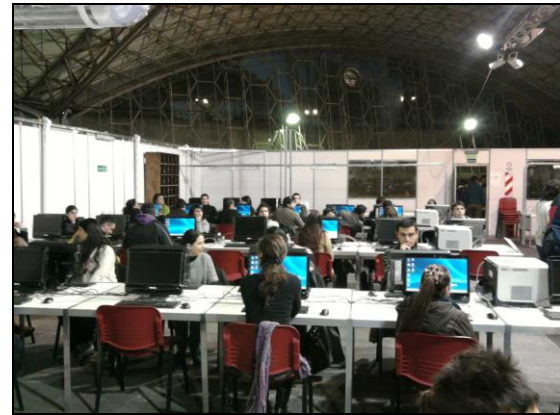
Centro de Cómputos para el escrutinio provisorio de las actas de votación en FERIAR

En otra iniciativa complementaria de la observación, Córdoba Transparente promovió que los electores se convirtieran en observadores electorales a través de su teléfono celular y de las redes sociales. Enviando un SMS al número 351 2581379 o desde su cuenta de Twitter pudieron informar lo que veían en su lugar de votación y contar su experiencia en el uso de la Boleta Única, utilizando los hashtags #CBAvota y #boletaunicaCBA. De esta manera se integró el trabajo de los observadores electorales de Córdoba Transparente con la perspectiva de todos los ciudadanos.