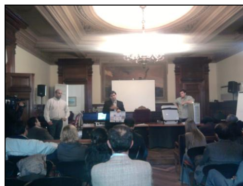
Presentación de MSA en Tribunales I

Como complemento de este estudio, los observadores de Córdoba Transparente asistieron al encuentro organizado por la Justicia provincial en que se presentó el modelo de Voto electrónico utilizado en Brasil. El sistema difiere de los utilizados en Córdoba, ya utiliza un teclado numérico en lugar de pantalla táctil, entre otras características. El análisis del mecanismo fue parcial, por tratarse la exposición de una presentación general, sin posibilidad de probar el funcionamiento del sistema “en situación de voto”.